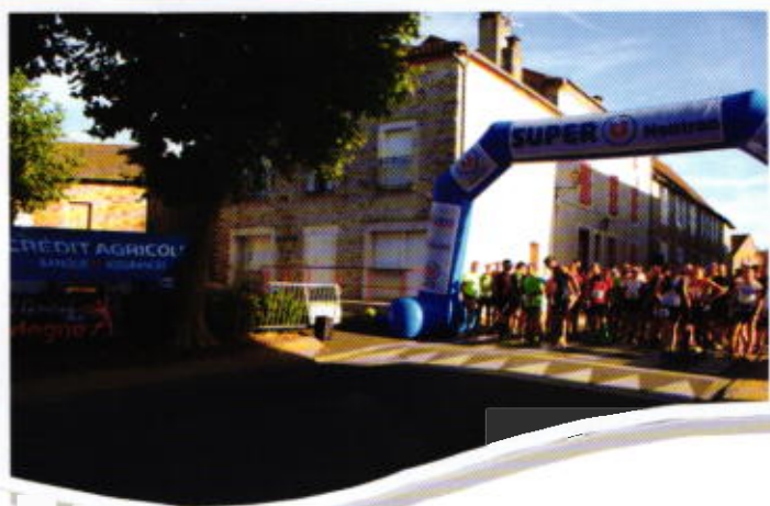
Association sportive et culturelle « LA MIALLETAISE »

Le 11 septembre 2016 a eu lieu la 2ème édition de la course à pied La Mialletaise avec une nette augmentation du nombre de participants par