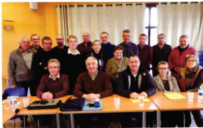
L'ensemble des élus du bureau de la nouvelle communauté de communes

Le nouveau Conseil communautaire est composé de 38 délégués, dont 1 pour Miallet.